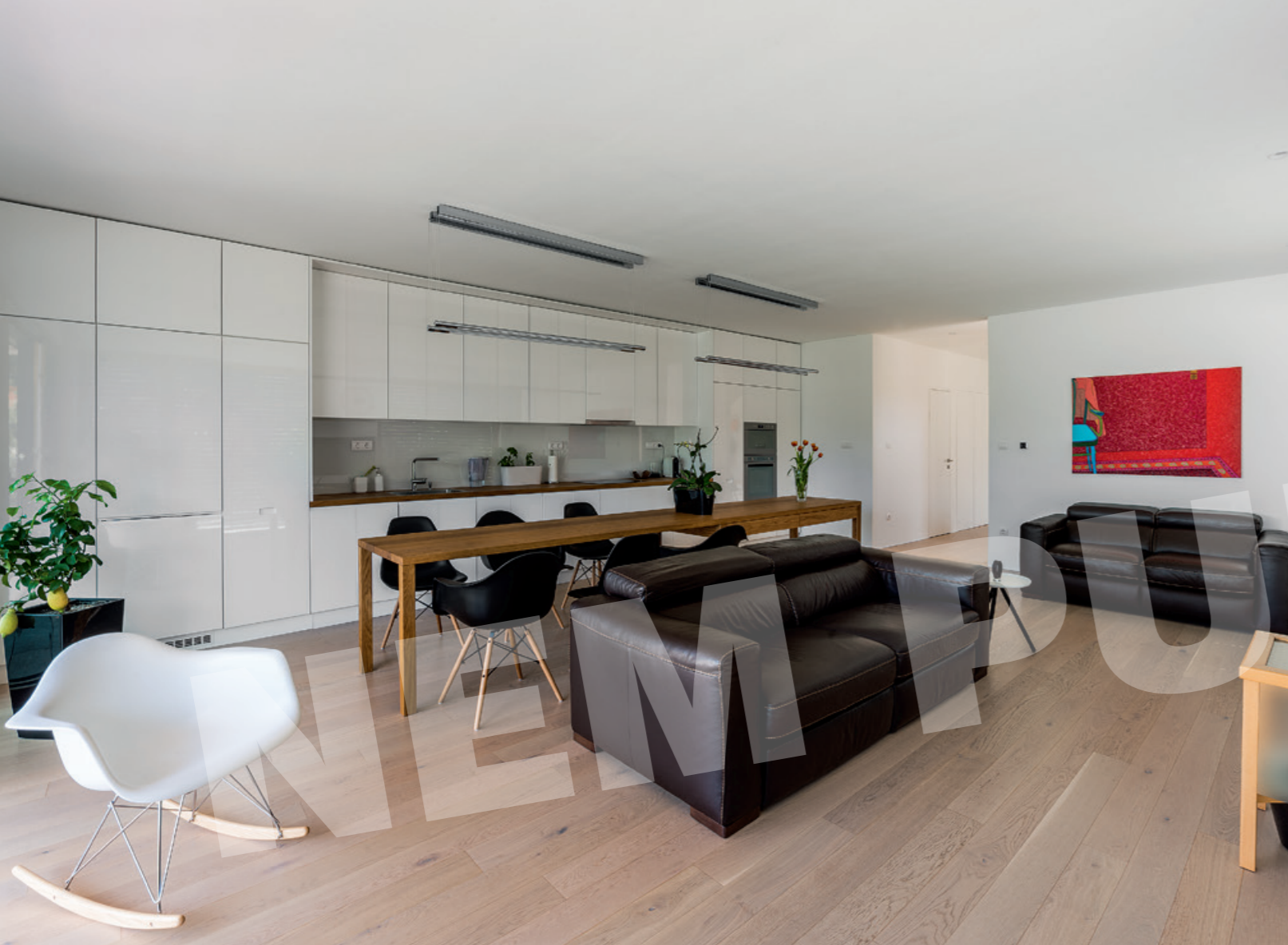
A konyha létjogosultsága manapság elfogadott az egyterűségben, de esztétikai okból szükséges volt semlegesíteni a közösségi tér bútorai között.