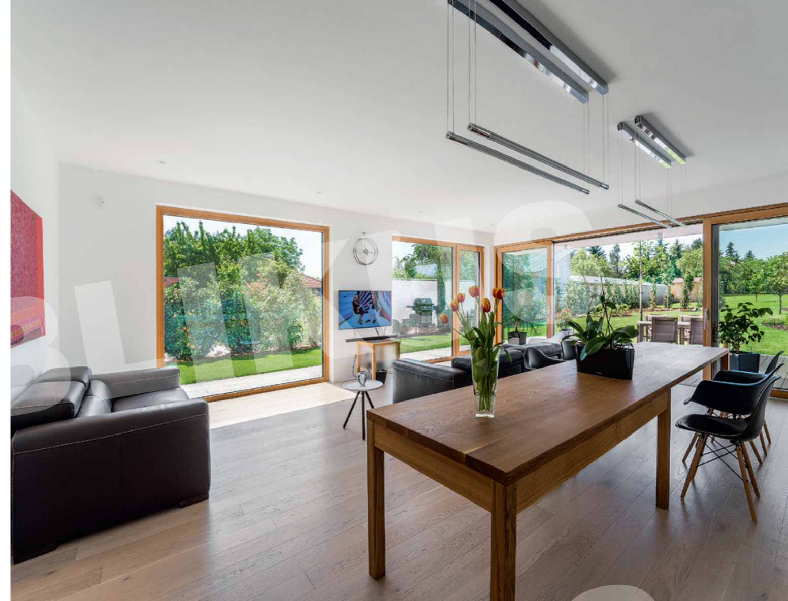
A természetes anyagok túlsúlya a kerti környezetre rímel az üvegfelületekkel megnyitott nappaliban, a zárt előtér a lépcsővel viszont semleges marad.

Az épület a 30-as évekbeli Bauhausra mai hangon reflektáló kubista kompozíció.