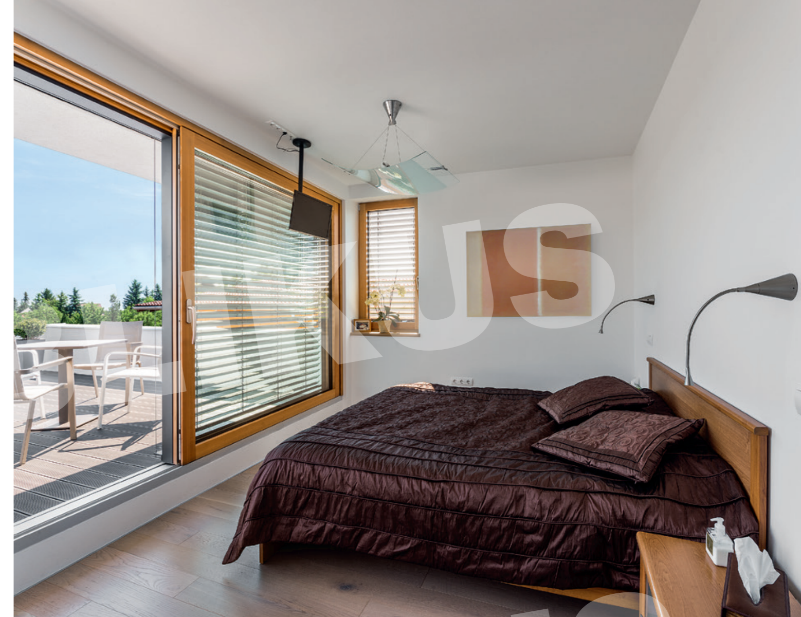
A szülői hálóhoz és a gyerekszobákhoz tervezett fürdők forma- és színválasztás, de bútorozás szempontjából is eltérnek a megszokottaktól.