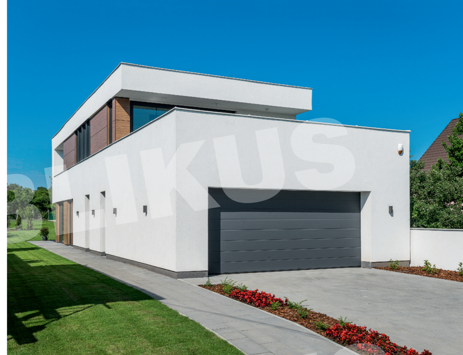
Az épületegyüttes zártsága és nyitottsága párhuzamosan felel a világos és a sötét párosítással, így emelve ki az építészeti hangsúlyokat.